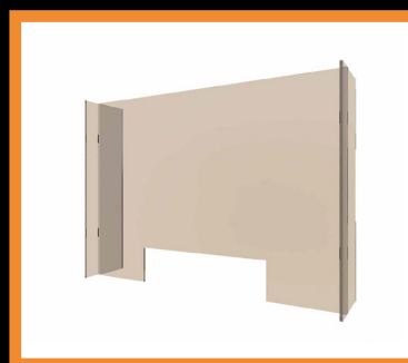
Separador de protección HORIZONTAL 910x600x190